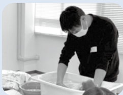
赤ちゃん人形を使った沐浴実習